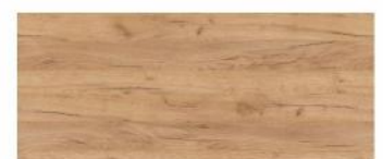
Dąb craft złoty