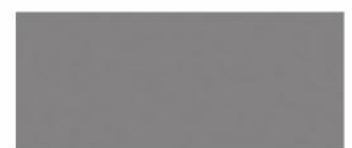
Jasny grafit korpusowy