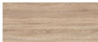
Dąb sonoma jasny