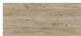
Dąb craft szary