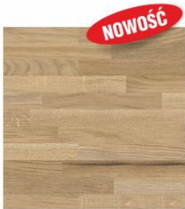
K091 FP v2

Dostępne gotowe formaty: 2000 x 640 x 10 mm, 4100 x 640 x 10 mm Możliwość docięcia i obróbki z podanych formatów.