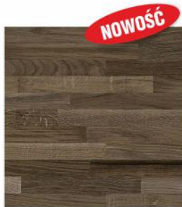
K092 FP v2